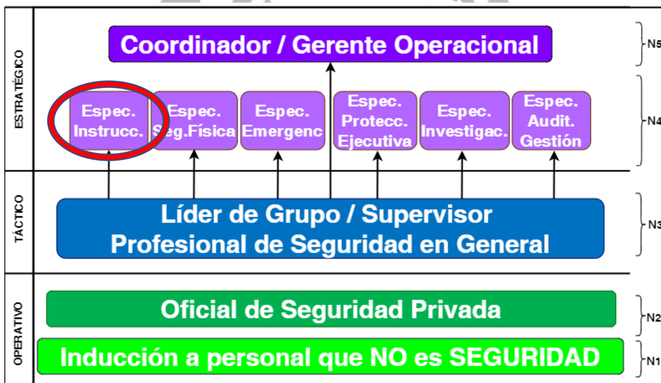
Ilustración 8: Pirámide roles industria de seguridad – Elaborada por el autor.