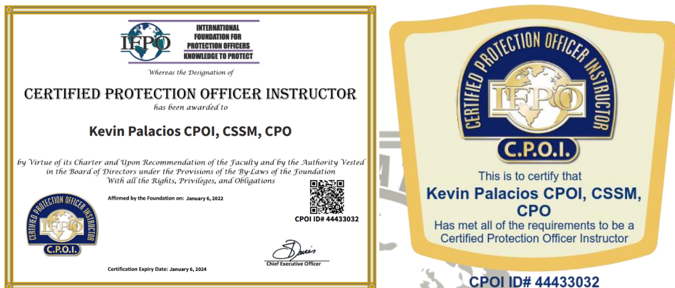
Ilustración 10: Muestra certificado y credencial digital CPOI

Los certificados CPOI ® legítimos están escritos en idioma inglés, poseen ID de certificación, y un código QR que direcciona a la página individual en el acreditador digital ACCREDIBLE.